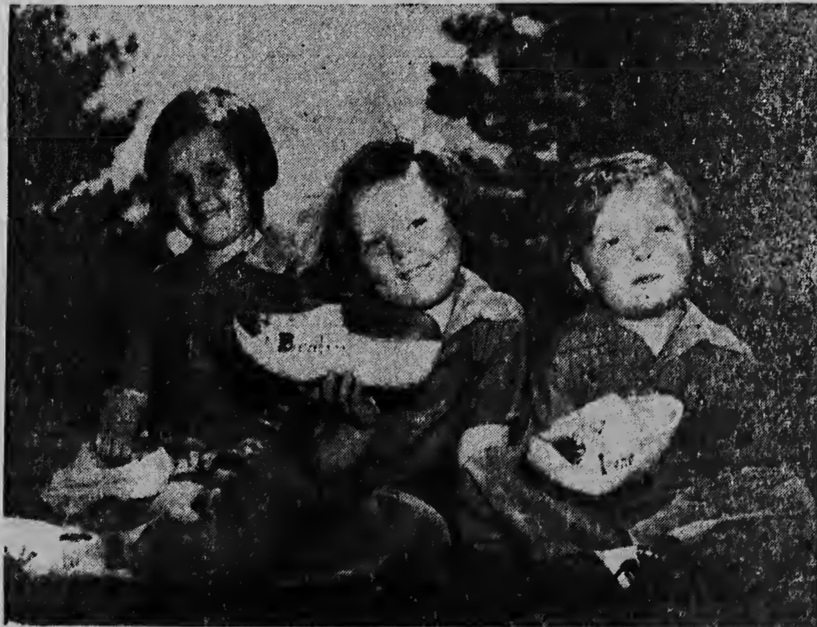
Durante di guerra la Reina a permuece eue e Prins cesanan na Canada. Seis anja Beatrix tin aki, eue ta sintu meimei y eue banda di die prinses Irene (drecbi) y Renette Roell su amiguita n'e otro banda. Portretnan manera esun aki a worde benta fur di bombarderunan Ingles riba Hulanda, eue tabata den poder di Alemania y esakinan tabata circula en secreto entre e poblacion, eue a halbe hantia brio for di portretnan di nan Reina, Prins y Prinsenan.